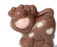
PRALINÉ ET ÉCLATS DE CRÊPE DENTELLE