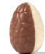
DUO PÂTE D'AMANDES ET PRALINÉ AVEC NOUGAT