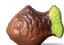
PRALINÉ ET NOIX DE COCO CARAMELISEE