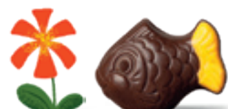
PRALINÉ ET ÉCLATS DE CRÊPE DENTELLE