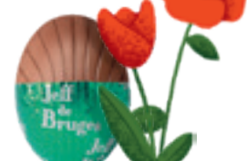
PRALINÉ ET ÉCLATS DE CRÊPE DENTELLE