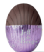
PRALINÉ AVEC ÉCLATS DE BISCUITS SABLÉS