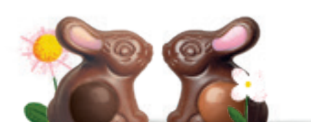
PRALINÉ ET RIZ SOUFFLÉ