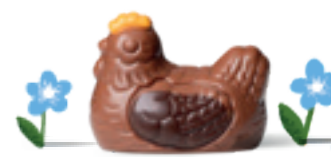
DUO PRALINÉ ET GANACHE CAMEL