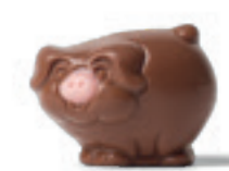
PRALINÉ ET ÉCLATS DE NOUGAT