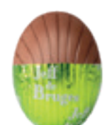
PRALINÉ ET ÉCLATS DE NOISETTES CARAMELISEES