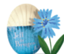
PRALINÉ ET ÉCLATS DE NOISETTES CARAMELISEES