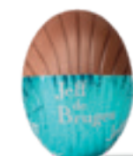
GANACHE CHOCOLAT NOIR ÉQUATEUR