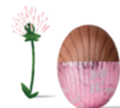
PRALINÉ NOISETTES FAÇON PÂTE À TARTINER