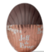
PRALINÉ ET NOIX DE COCO CARAMELISEE