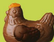
Duo praliné et ganache caramel