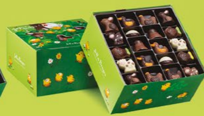
LE BALLOTIN DE 750 G NET 60 CHOCOLATS ASSORTIS