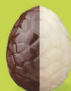
Praliné avec éclats de noisettes